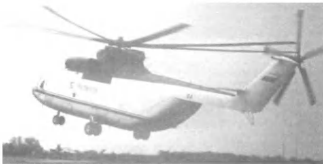
Новенький Ми-26Т ждет своего заказчика.

Глядя на то, с какой легкостью летчики пилотировали тяжелые винтокрылые машины, хочется воскликнуть: "Разве найдется такая сила, чтобы отлучить отечественную авиацию от неба!"